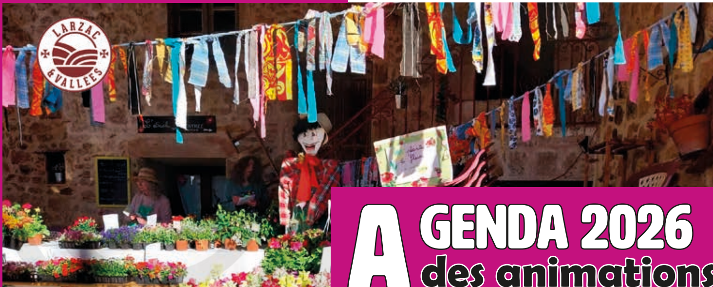
Foire de Printemps à Sauclières