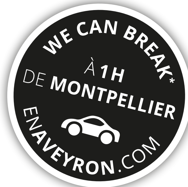
MACARON AVEC DISTANCE