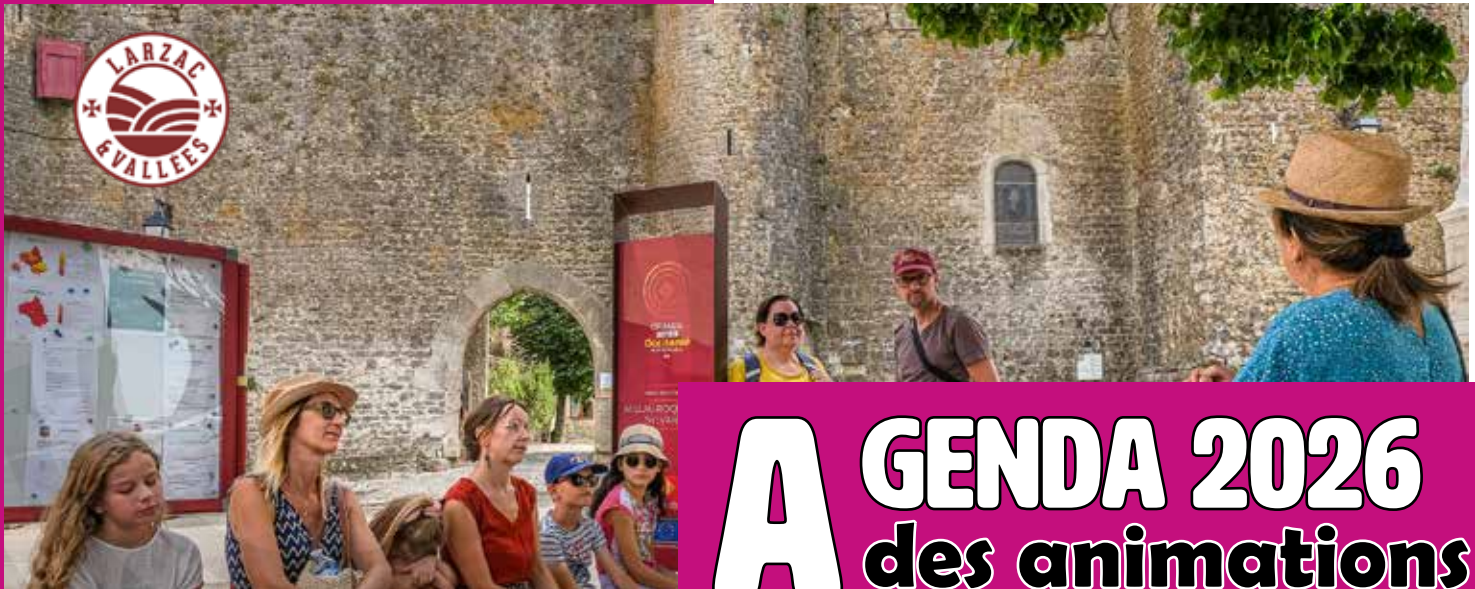
Visite guidée fort de St-Jean d'Alcas